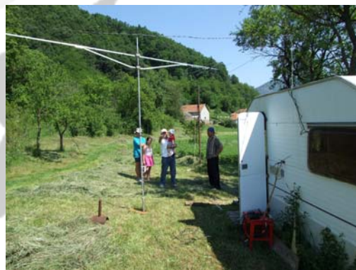
YO2KQY in KN15MW