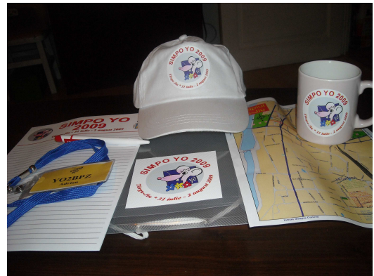
Mapa ,notes, sapca, pix, cana, ecuson (si altele...).

Dupa intocmirea “occidentala” a programului, promovarea actiunii a fost un scop major: pe langa promovarea in randurile radioamatorilor, multe articole in presa, emisiuni la radio si televiziune, spoturi publicitare, atragere de sponsori, etc.