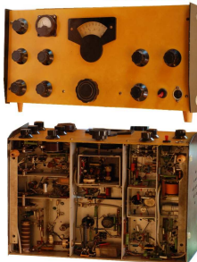
Nostalgia TRX by Ex HA8CN 80/20m SSB-CW Showed by HA8LUA