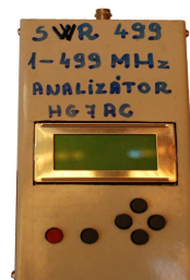
Made by HG7AC