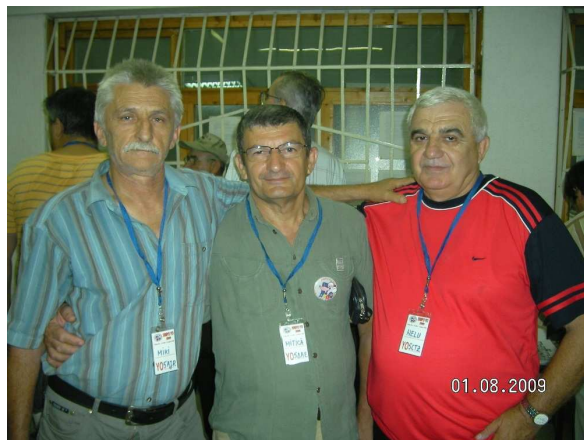
YO5AJR, 5DAE, 5CTZ

Un parc bine ingrijit unde "masa tacerii" si "poarta sarutului" ale lui Brancusi innobilau totul. Chiar webcam - uri prin care m-au vazut si ai mei de acasa din Tautii Magheraus. Orasul candva vatra a unui sat dacic, inainte de cucerirea Daciei de catre romani , poarta in intregime amprenta de oameni gospodari cu respect pentru curatenie.