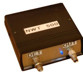
Made by HG8LMQ