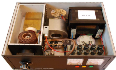
Made by HA8CL