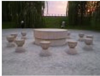
Targu Jiu –doua simboluri

Drumul prin Calan - Petrosani ne oferea privelisti dezolante. Uzine transformate in ruine, cladiri candva semete devastate, defileul spre Targu Jiu ofera putine parcuri civilizate. Nu am mai fost la Targu Jiu si cu strangere de inima asteptam ca punctul final sa semene cu impresiile avute pe drum. Intrand in oras am ramas cu totii muti de surpriza extrem de placuta a ceea ce am gasit