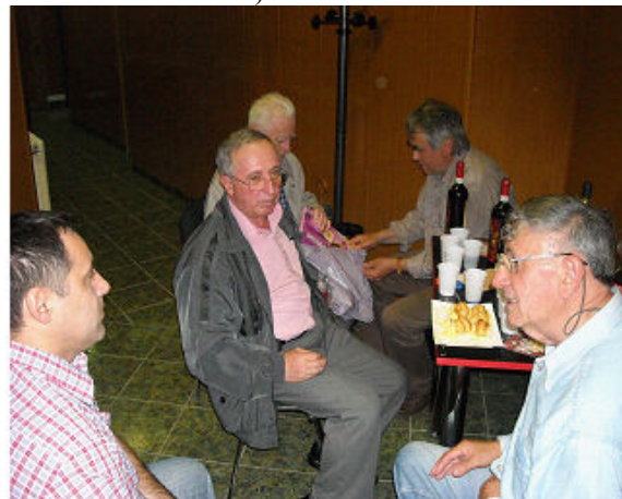
Intalnirea la Primatelecom Deva

Anul acesta cu ocazia YO/HD Simpo, datorita unor activitati mai deosebite derulate la Mako in aceasta perioada ( festivitatile de absolvire a ultimei clase de liceu – fiica lui Feri HA8EA si fiul lui Misi, HA8EB),