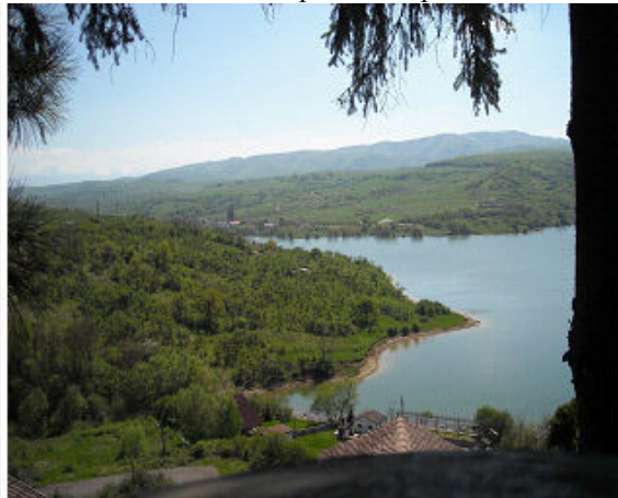
Pranzul la Motel Cincis

Am plecat la cazare la o superba pensiune (Sub Cetate Deva) de care oaspetii nostri au fost foarte incantati si multumiti.