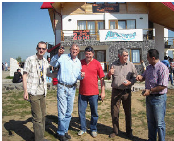
La Pensiunea Panorama in zi de “enduro”

Am plecat imediat spre lacul Cincis, unde, intr-o priveliste intr-adevar superba, dominate de oglinda lacului Cincis si in departare varfurile inzapezite ale Retezatului, am servit masa de pranz, o excelenta specialitate a casei (Motel Cincis).