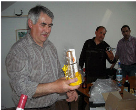
La Clubul Copiilor Hateg

. fost uimiti sa vedem la un loc atatia pasionati ai motocicletelo de teren din tara si din strainatate In continuare am plecat spre Clubul Copiilor Hateg, unde ne asteptau ( cam de mult timp, nu am avut cum sa nu decalam programul!), radioamatorii din Hateg si Imi (YO2LTF) din Petrosani.. Atmosfera deosebit de destinsa si placuta, caracteristica a ospitalitatii radioamatorilor din Hateg, in frunte cu YO2CBK si LRH.