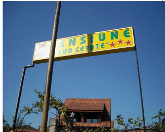
Pensiunea "Sub Cetate" Deva