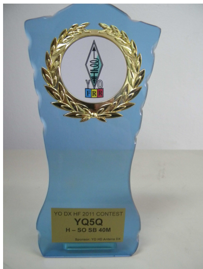
YQ5Q – sponsor YOHD DX