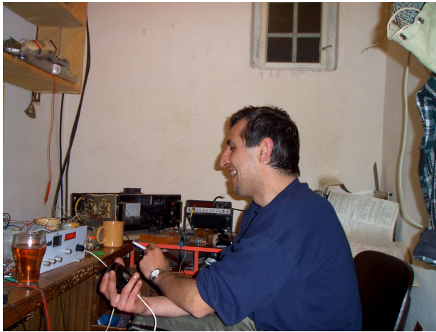
Prima legatura cu W!