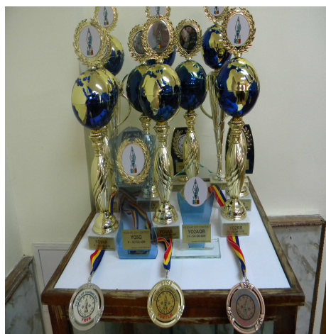
Cupe, medalii si plachete statii YO