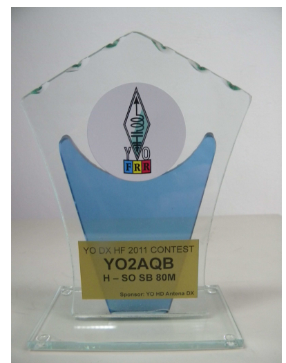
YO2AQB –sponsor YOHD DX

Cu ocazia zilei de 8 Martie, tuturor radioamatoarelor, fiicelor, sotiiilor, mamelor si prietenelor noastre, un calduros “La multi ani!”