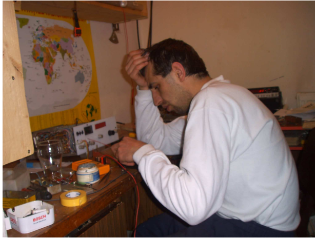
Nimic nu functioneaza!

Pe la 11 noaptea , de Craciun a sunat vecinul ca nu mai vede nimic la televizor in ritm de telegrafie... Aveam confirmarea...suntem auziti...FUNCTIONEAZA !