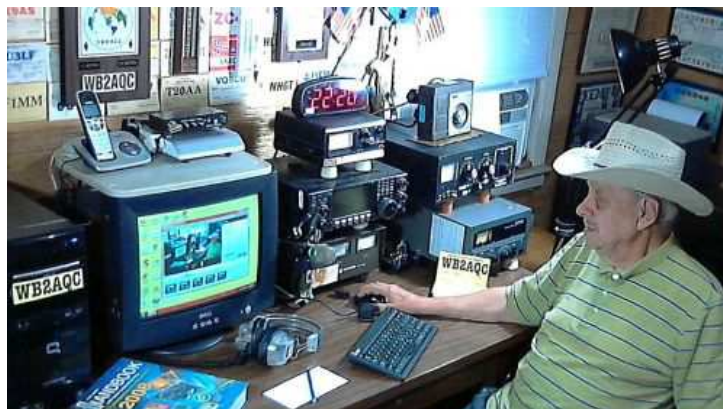
WB2AQC la statie

Era in timpul razboiului, Romania era izolata de tarile producatoare de cacao, deci si de ciocolata. Totusi, cumva se gasea si de astea dar scump si mai rar. Cateodata, nu prea des, tatal meu mi-a dat o bucatica mica invelita in staniol. Mi-a placut mult. Ma gandeam ca daca voi ajunge candva in rai acolo voi avea o punga intreaga de ciocolata. Situatiia s-a schimbat. Acum pot avea si kilograme de cea mai buna ciocolata, prefer cea cu lapte, dar nu stiu daca sunt pe drumul cel bun spre rai. Cu sau fara ciocolata, poate insa voi ajunge acolo(?).