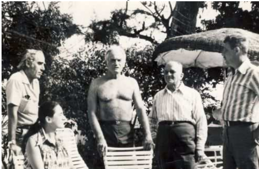
Senatorul Barry Goldwater K7UGA în centru, WB2AQC în partea dreaptă

După sosire a trebuit să aștept 5 ani până la primirea cetățeniei, pe atunci condiție necesară pentru obținerea unei autorizații de radioamator. Frustrat de lungă așteptare, am luat legătura cu diversi membri ai Congresului american arătând că autorizațiile de radioamator nu ar trebui să fie condiționate de calitatea de cetățean. Am argumentat printre altele "dacă unul este bun pentru o rețea cu 240 de stațiuni de TV, de ce nu este bun și pentru o mică stație de radioamator?" Barry Goldwater, pe atunci senator din Arizona și radioamator pasionat, K7UGA, a înțeles problema și la insistențele mele a introdus un proiect de lege care a fost votat și a permis și necetățenilor care însă posedă un "green card" să devină radioamatori. Așa am devenit WB2AQC.