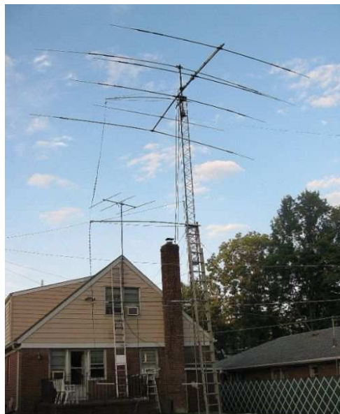
Pilonul si antena statiei WB2AQC